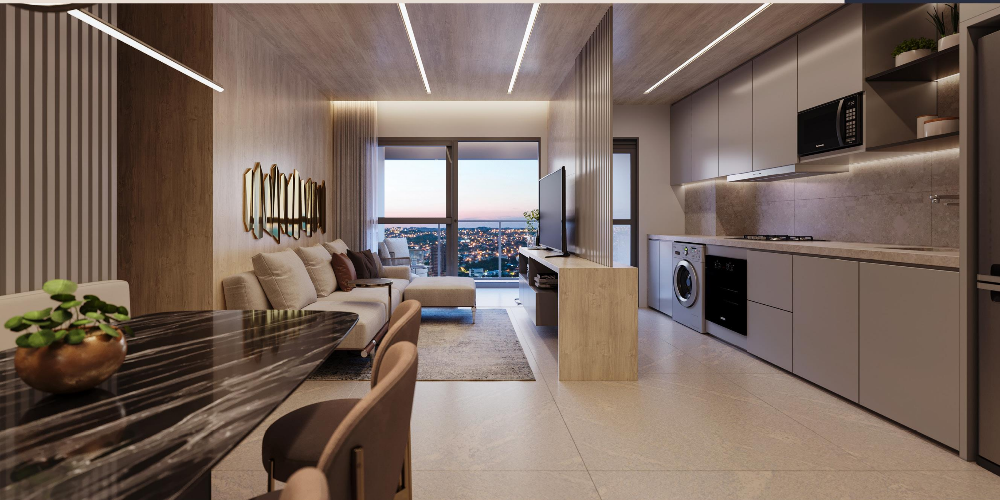
Apartamento Tipo 2 | Jantar/Estar/Cozinha