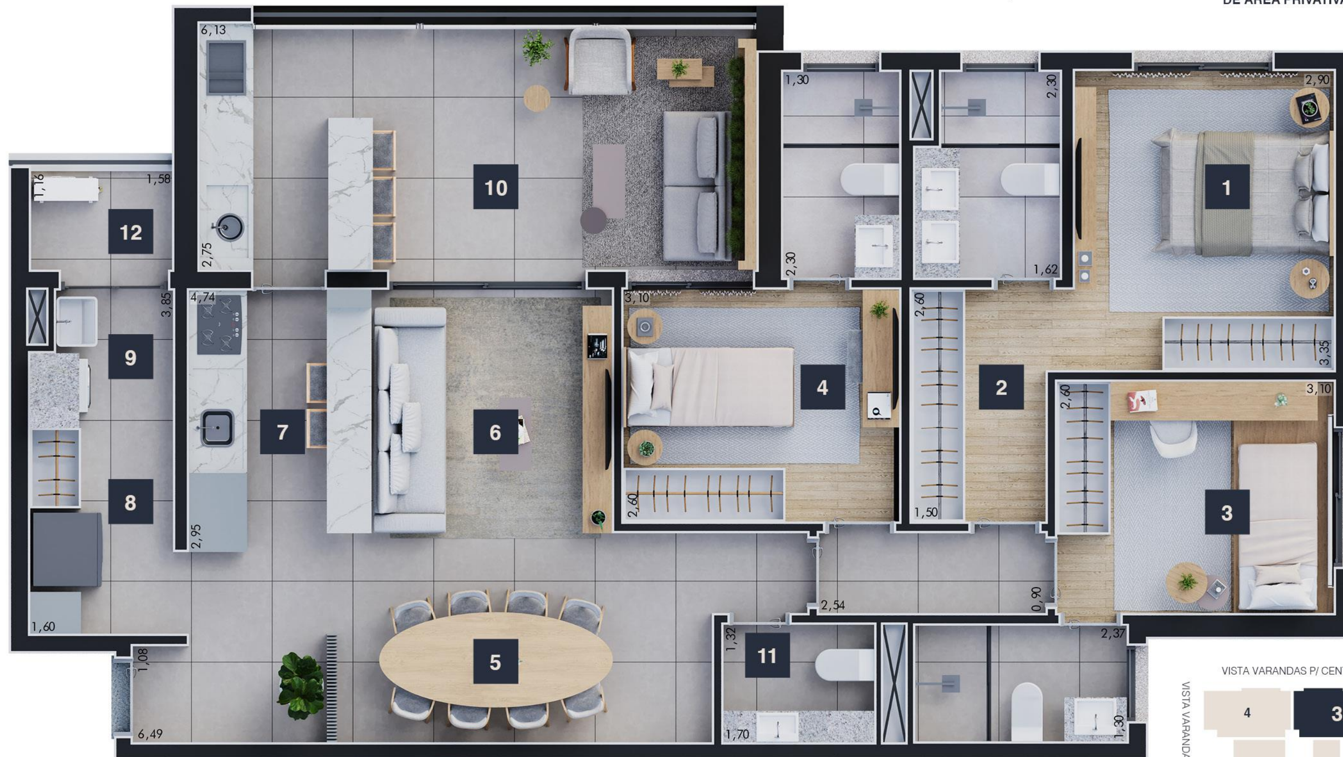
Planta final 3

3 SUÍTES COM 115,23m 2 DE ÁREA PRIVATIVA