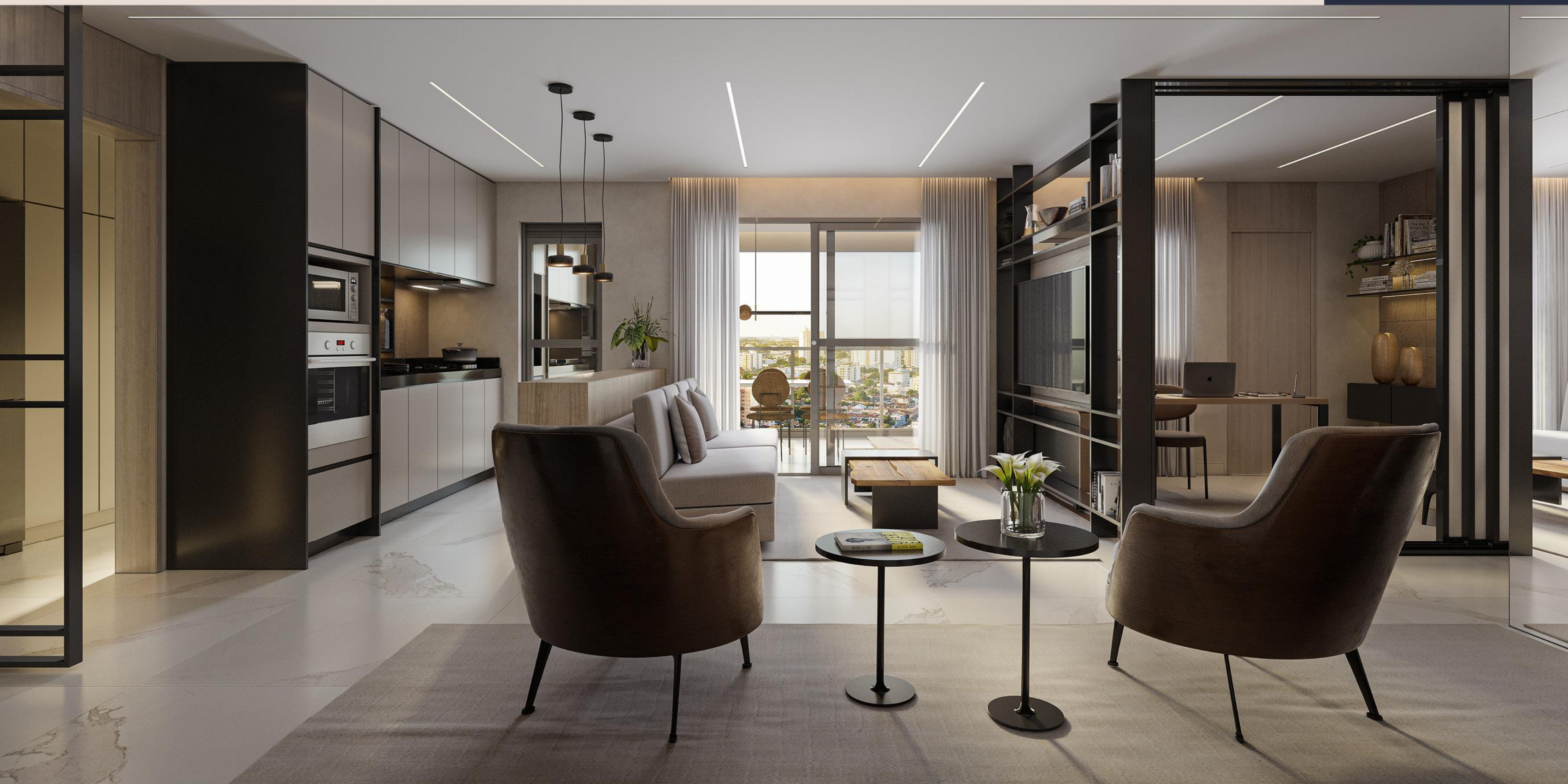
Apartamento Tipo 1 | Jantar/Estar/Cozinha

3 SUÍTES COM 115,23m 2 DE ÁREA PRIVATIVA