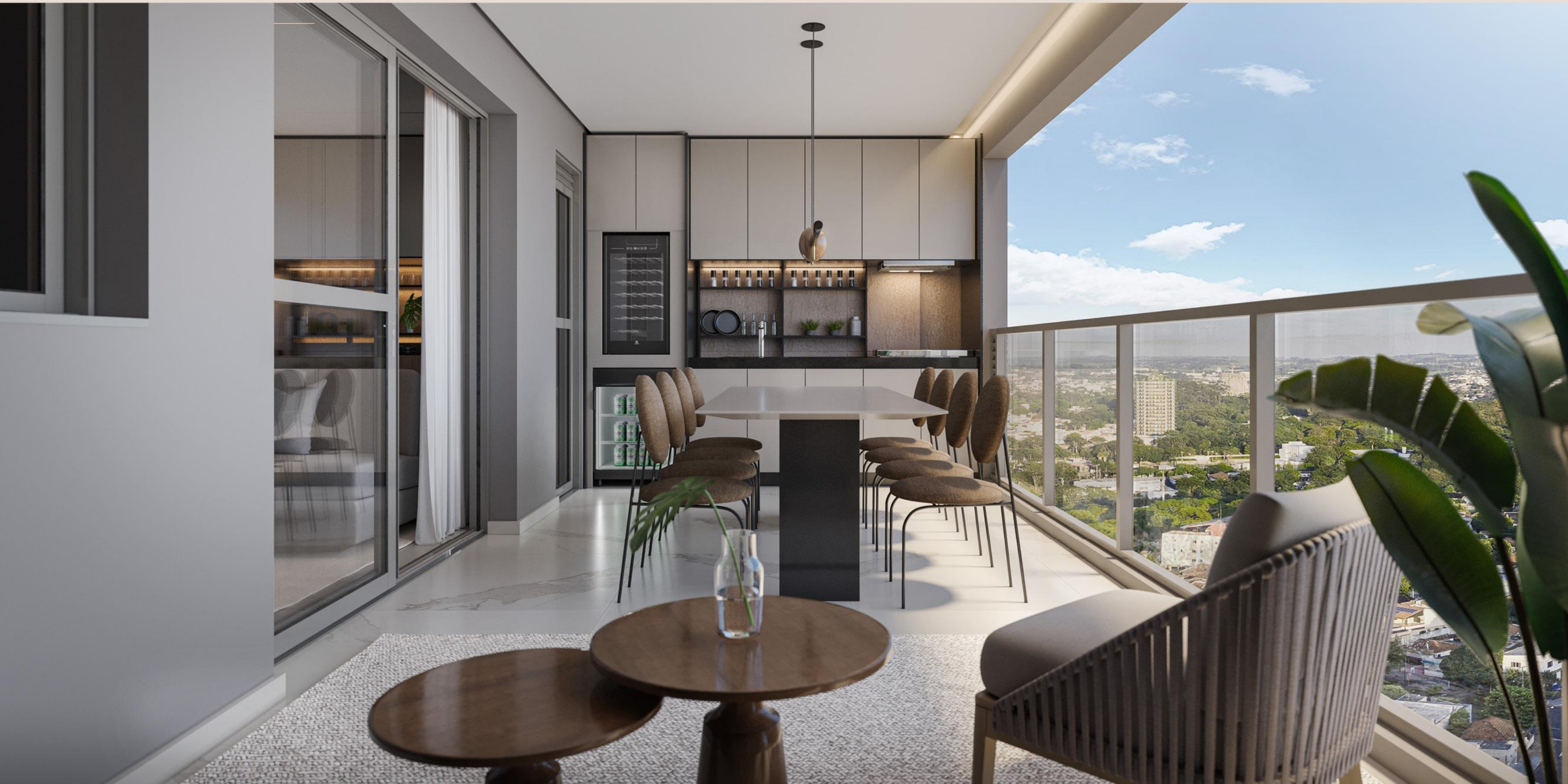
Apartamento Tipo 1 | Varanda Gourmet

3 SUÍTES COM 115,23m 2 DE ÁREA PRIVATIVA