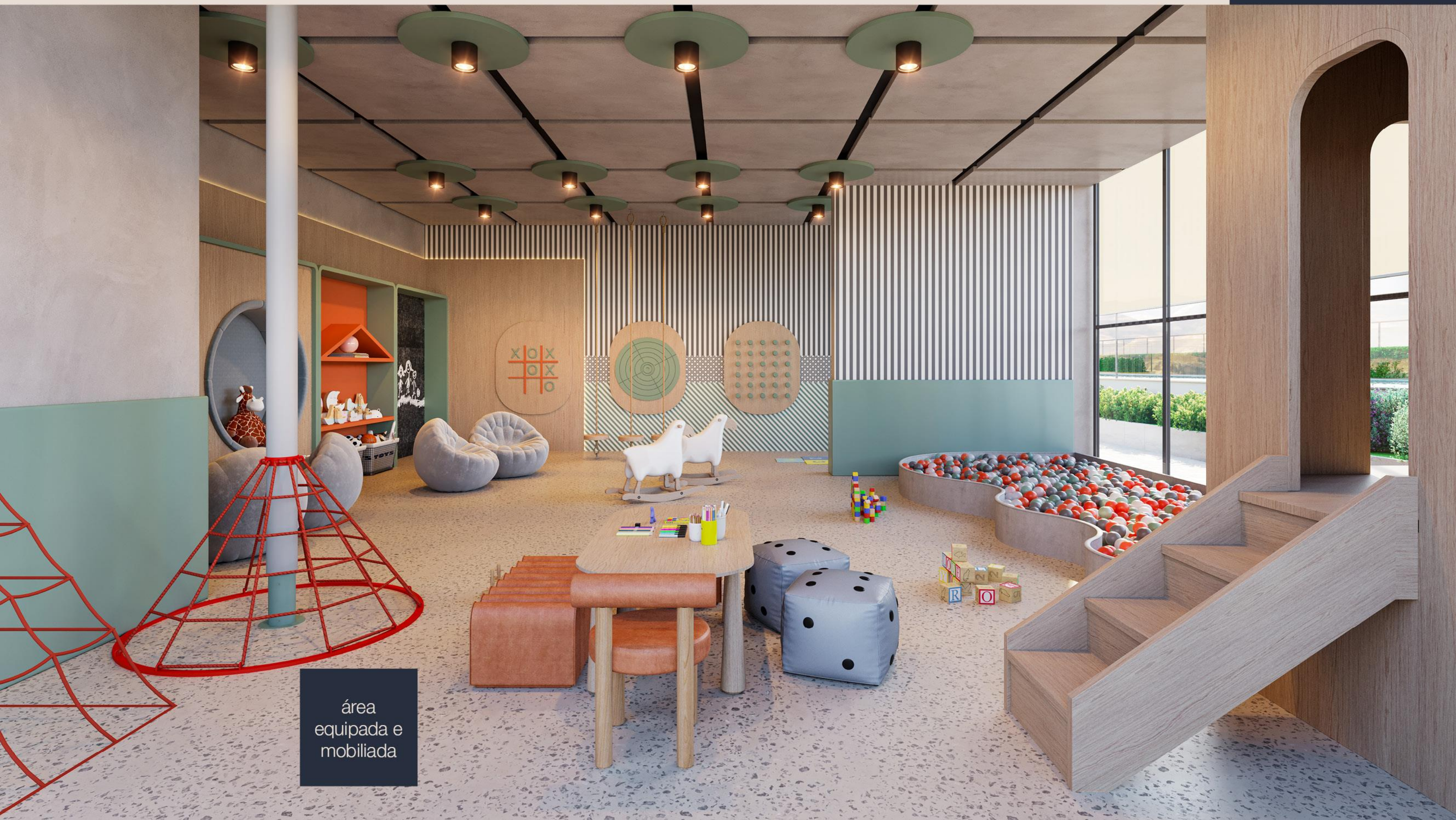
área equipada e mobiada

Equipada com brinquedos lúdicos, projetados para o desenvolvimento e a diversão das crianças.