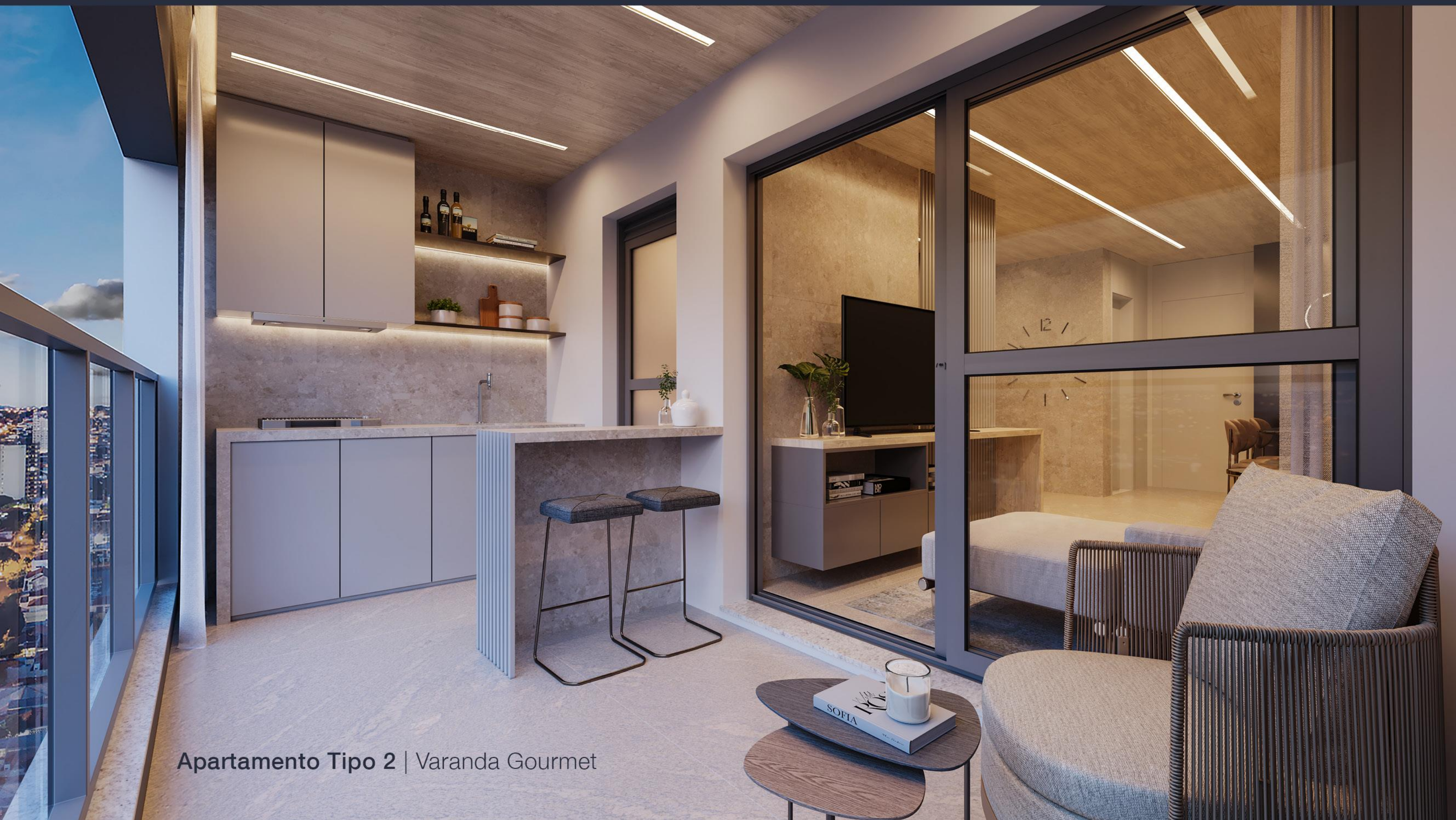
Apartamento Tipo 2 | Varanda Gourmet