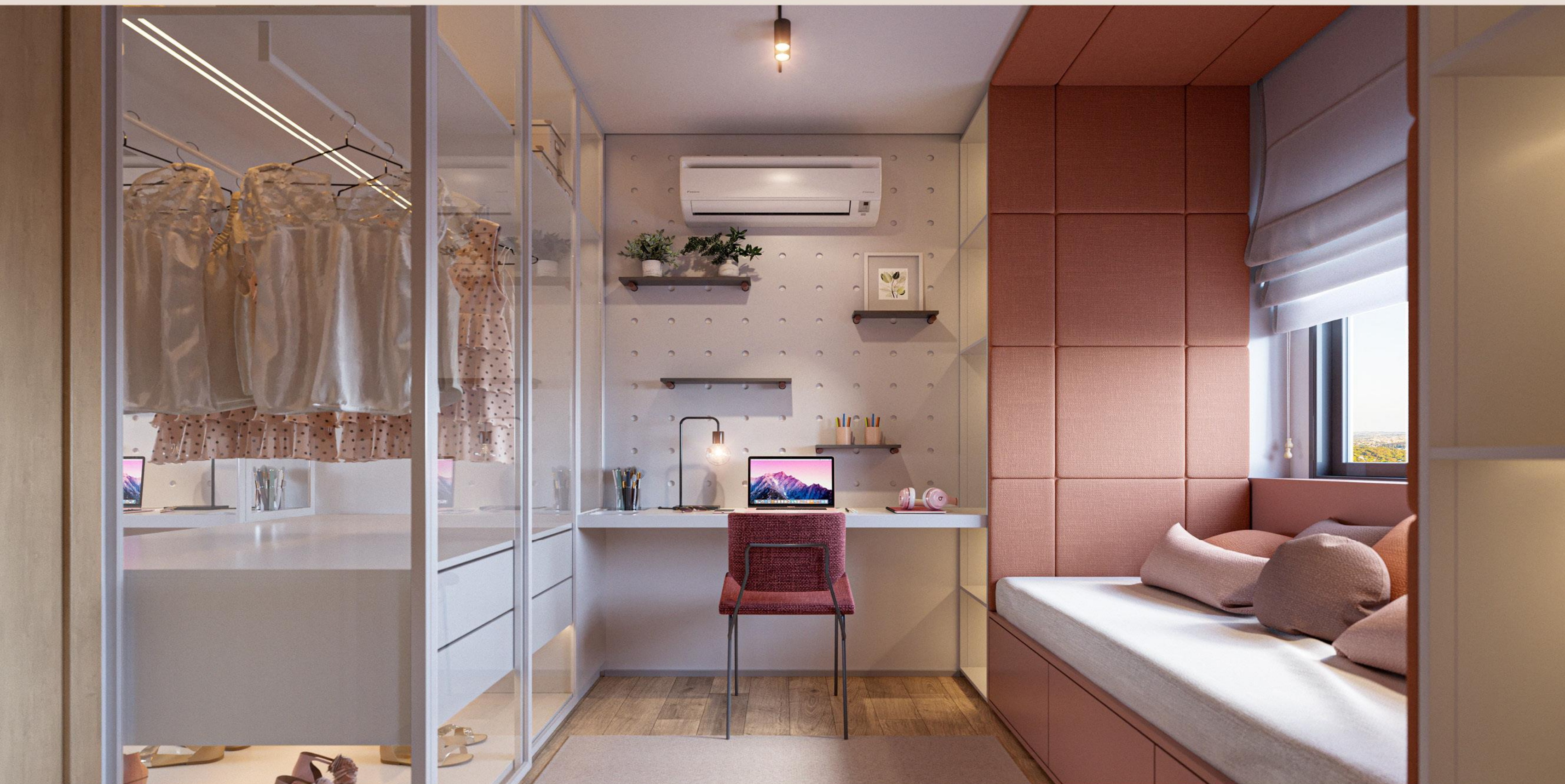
Apartamento Tipo 1 | Suíte

3 SUÍTES COM 115,23m 2 DE ÁREA PRIVATIVA