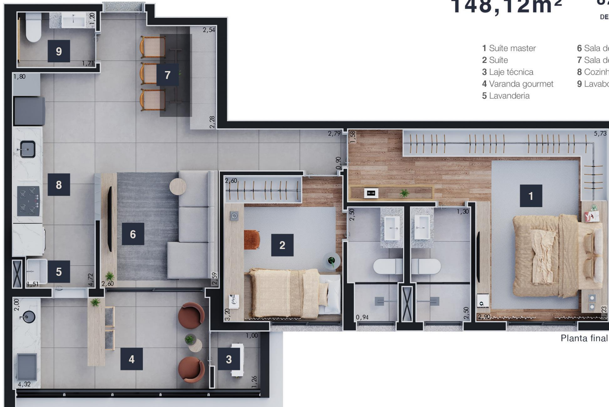
Planta final 2